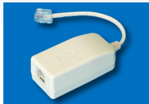
線路抵抗調整部品